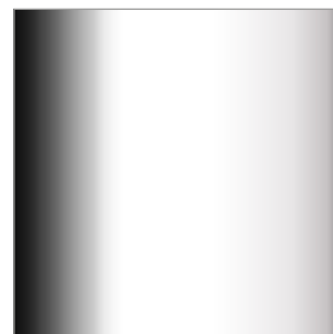
N4 Chrome gloss / Chrom lesk Chrom glanz / Chrome brillant

Informace o možnostech provedení povrchové úpravy kovových komponentů pro určitý výrobek naleznete v ceníku.